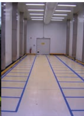
Enceinte de traitement