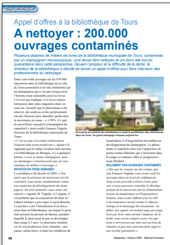
C'était il ya 2 ans déjà, et l'on ignorait alors que les 650.000 ouvrages seraient à nettoyer...

Le problème avait été décelé en 2004. « Peu après que la présence de moisissure ait été constatée, nous avons soudainement connu une explosion du développement du champignon. En trois semaines, nous avons été infestés » regrettait le directeur. A l'origine, il est probable que la conjonction de deux incidents mineurs a provoqué ce petit désastre. Le premier a été l'introduction d'un document dans la bibliothèque, sur lequel le spore était présent (la période de latence, pendant laquelle le spore peut ne pas se développer dure jusqu'à 5 ans). Le deuxième incident est lié à la production d'air climatisé : une panne, même brève a réuni les