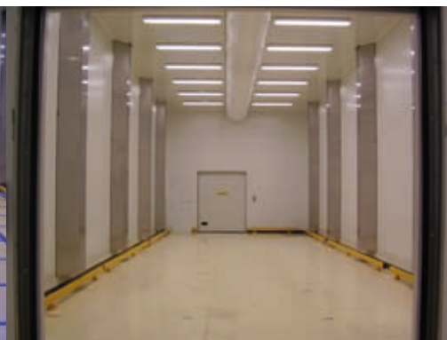
Salle de désorption