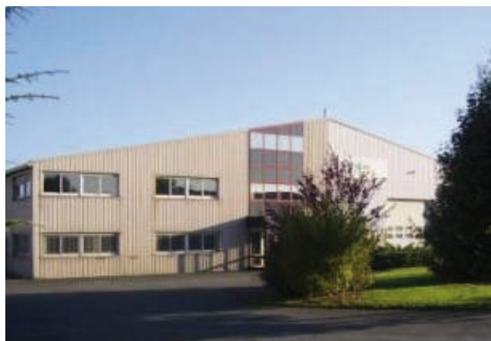
Les locaux de Stérylène

Stérylène est aussi équipé d'une capacité de stockage dynamique de plus de 100 m 3 avec contrôle de la température et de l'hygrométrie particulièrement destinée à l'aération des archives et des collections des bibliothèques après traitement dans l'attente du seuil d'OER souhaité.