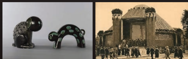
Tapis de Primavera en couverture d'un catalogue de 1929 - C. Lévy. Vases polylobés en céramique flamme façonnés par C.A.B. (v. 1925) - Deux animaux-clowns façonnés par C.A.B. (v. 1930) - Le pavillon Primavera à l'Exposition de 1925.

L'actualisation des formes sous l'influence du cubisme y sera mise en œuvre par des créatrices pleines de talent comme Claude Lévy et Madeleine Sougez; et, grâce à l'esprit moderniste de Louis Sognot, puis à l'intervention opportune de Jacques Viénot au cours de la décennie